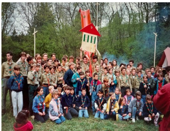
27 avril 2002 Inauguration de « La Sardoché »