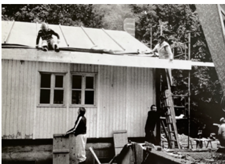
1995 Premières séances scouts dans la Cabane